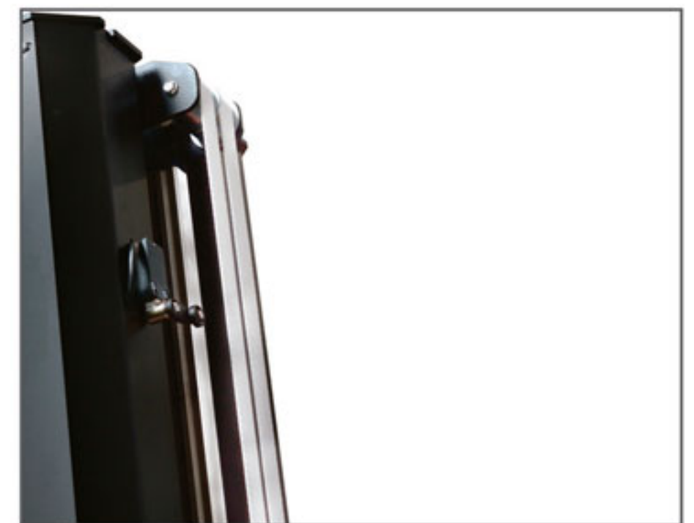
SISTEMA DE SEGURIDAD DE DOBLE CORREA